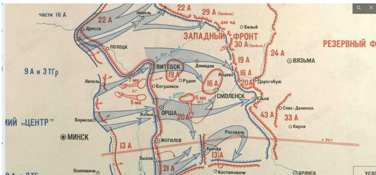
Рис.1 Схема №11 Западный и резервный фронты Смоленское оборонительное сражение 03.07.41 – 07.08.41