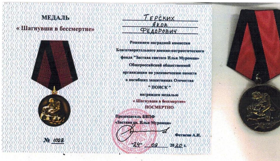
Приложение 6: Торжественное захоронение солдат в сентябре 2020 г. г Ярцево